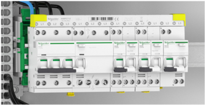
Image of assembly of product