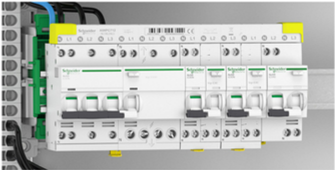
Image of assembly of product